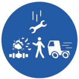
Line of Fire

Keep yourself and others out of the line of fire